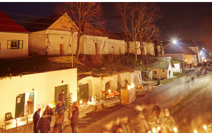
Hadres, © Michael Liebert

Genussvoll flanieren die Besucher:innen zwischen Kunst- handwerk und Weihnachtsdeko- ration durch die vielen geöffne-