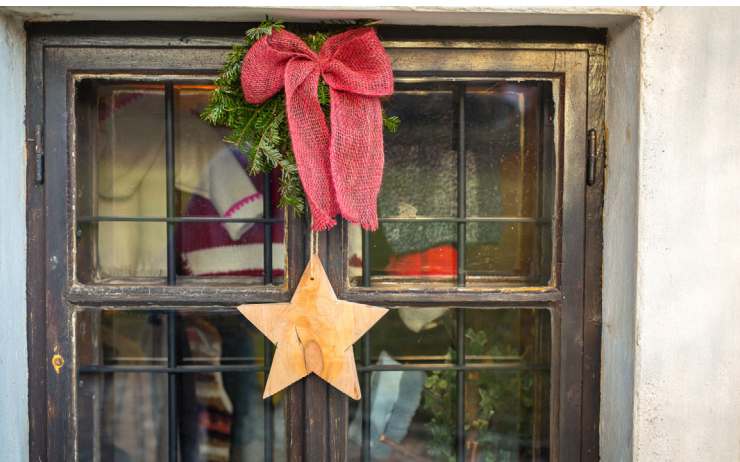
Museumsdorf Krumbach, © Wiener Alpen/Christian Kremsl