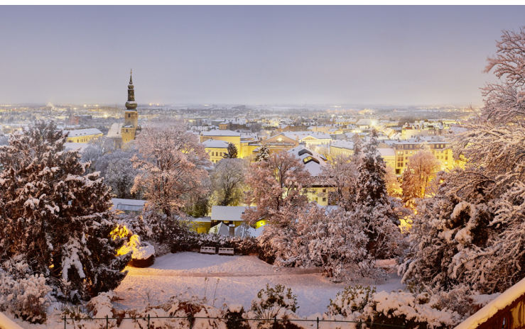
Baden bei Wien