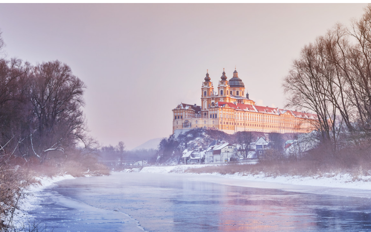
Stift Melk

5. bis 20. November, jeweils Sa/So 10–19 Uhr